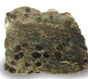
V. l. n. r.: Graphit aus Amstall (NÖ), Wulfenit aus Bleiberg (K) und Granat aus der Region Radenthein (K).