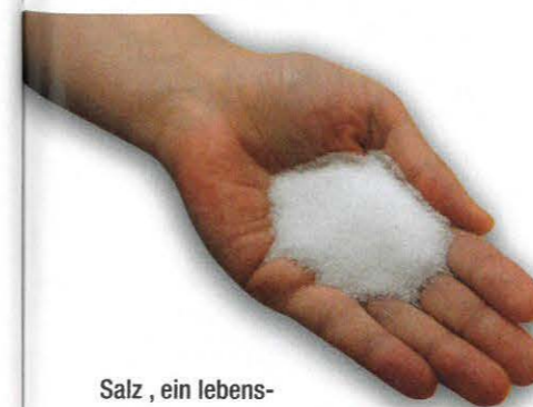
Salz, ein lebenswichtiges Industriemineral.

Salz ist zweifelsfrei für Mensch und Tier lebenswichtig. Rohstoffgeologen ordnen es wegen seiner großen (industriellen) Bedeutung – wobei Salzstreuung nur ein Aspekt ist – in die Gruppe der Industriemineralien ein. Andere Vertreter der Industriemineralien sind etwa Gips oder Graphit. Wenn Gips im selben Environment wie Salz ent-