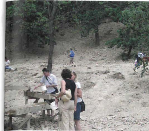
Beliebt bei Alt und Jung: Amethystsuche im Freigelände der Maissauer Amethyst Welt.

ermark ist der Erzberg, das mineralogische sind die dort vorkommenden, einem Medusenhaupt gleichenden Aggregate der Eisenblüte (Aragonit). Diese Stufen zeigen in eindrucksvoller Weise, dass die feinen Nadeln in offene Hohlräume hineinwuchsen. Für das Burgenland wäre als „Landesmineral“ der Antimonit aus Schläining zu nennen.