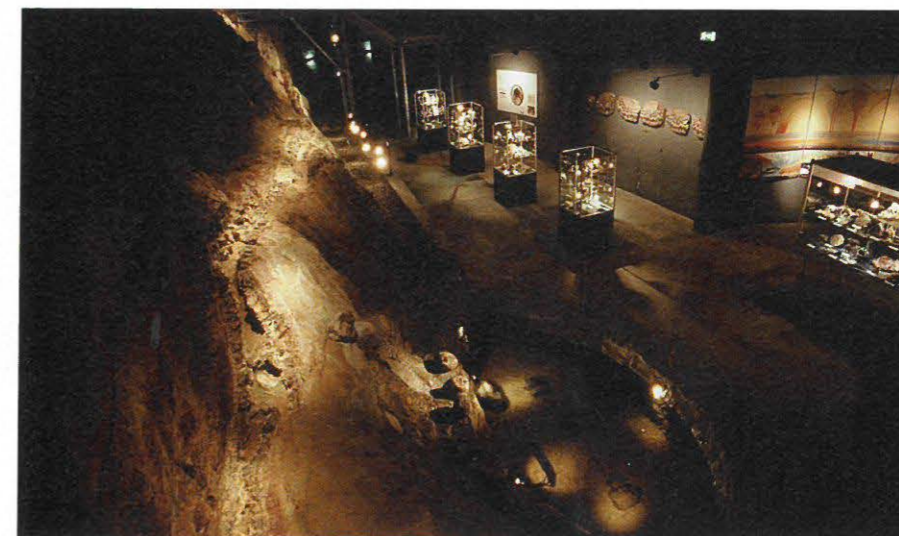
Das touristisch erschlossene Amethystvorkommen in der Maissauer Amethyst Welt (NÖ).

Wer Salz unter der Lupe betrachtet, erkennt winzige, würfelige Kristalle. Hier zweifelt keiner länger an der Kristallnatur des „Halits“, so einer der