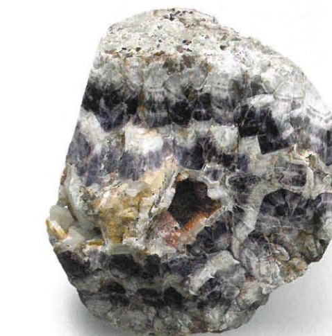
Maissauer Amethyst mit seiner typischen violett-weißen Zonierung.